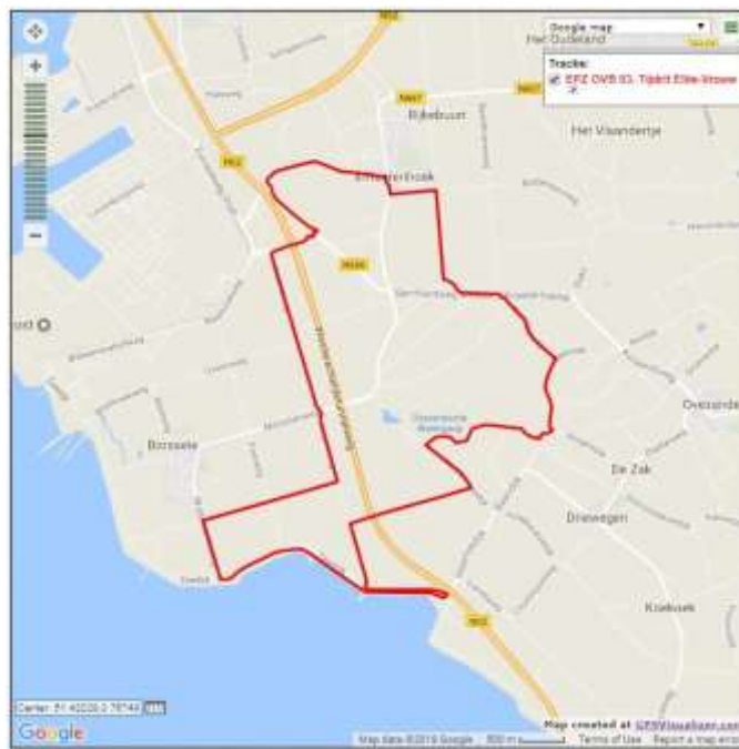
Afbeelding 2: Routekaart tijdrit Elite Vrouwen Map 2: Course for time trail Elite Women